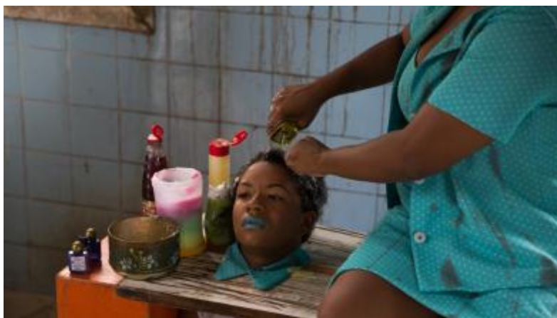
Cena do documentário Kbela (2015).

O que “Kbela” (2015) consegue fazer é produzir um olhar poético para toda essa discussão tão exaustiva quanto necessária. É uma produção de uma mulher negra, oriunda de Nova Iguaçu, na Baixada Fluminense, Rio de Janeiro, que consegue, a partir de uma linguagem