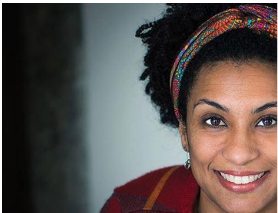
Marielle Franco, ativista política e vereadora assassinada em 2018, no RJ.

Então, como lidar com isso, tendo que ouvir de pares brancos e alguns negros, dependendo da localização política de cada um deles, coisas como lugar da fala, lugar de poder, tombamento, lacração e até apropriação porque meus estudos apontam para uma contribuição reflexiva sobre corpo, cultura e educação, pilares onde foram fincadas as estruturas racistas? Por que devo reclamar dos tombamentos dos movimentos negros que divergem tal qual a dominância branca? Que cor tem o tombamento de um golpe de impeachment