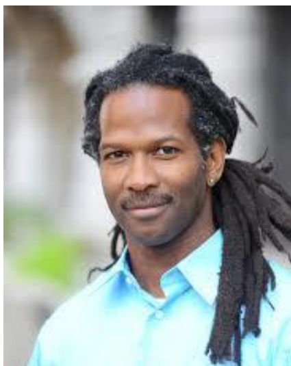
Carl Hart, neurocientista e professor de Psicologia e Psiquiatria da Universidade de Columbia nos Estados Unidos.

Falo da luta antirracista na Educação por ser este o meu lugar de poder neste momento, mas entendo que ela se dá em âmbitos mais amplos como a saúde, a habitação, a renda e o emprego, o lazer, a cultura e os espaços institucionais. De qual erro grave e infortúnio maiores estamos falando? Desprotagonizar negros e negras destes espaços é manipular mais uma vez a história, a cultura e a educação que são pontes eficazes para promover a justiça racial no país. Falando do meu ponto de vista de mulher