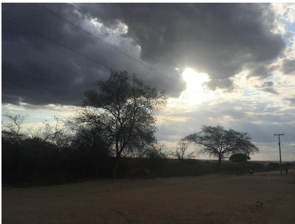
Figura 1- Imagem representativa do Território Quilombola do Sítio Arruda em Araripe-CE.