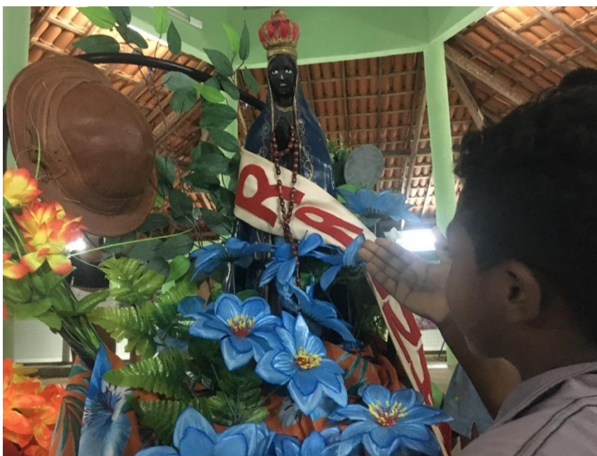
Figura 3 - Imagem representativa da religiosidade praticada pela Comunidade Quilombola do Sítio Arruda.